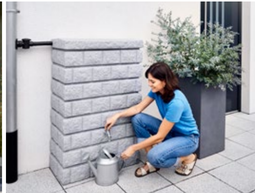
Rocky Wandtank 300-400 L Farben: darkgranite, lightgranite, sandstone, redstone