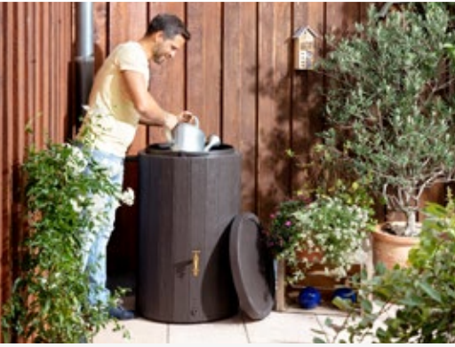
Timber Regenspeicher 230 L in Holzoptik inkl. abnehmbarem Deckel