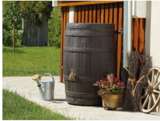
Barrica Regenfass 260-420 L in Holzoptik inkl. abnehmbarem Deckel