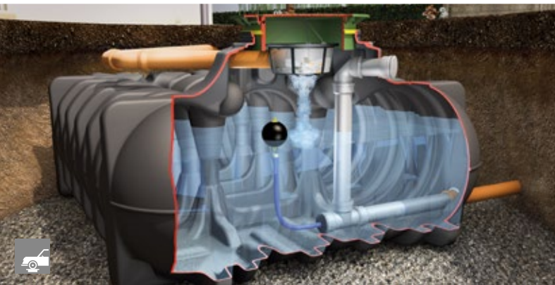
Platin Retentionszisterne 1.500-65.000 l