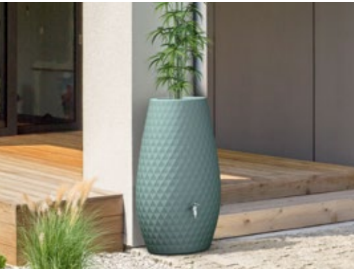
Triagon 2in1 Regenspeicher 230 L Farben: agave, arctic, graphitgrey, inkl. Pflanzschale