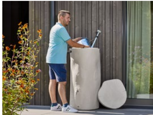
Woodstock Regenspeicher 250-400 L Farben: greywood, pinewood, lightwood, inkl. abnehmbarem Deckel