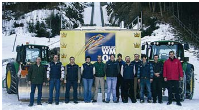
Freundlich, nah, für alle da: Das Team des Landmarkt Technik Centers am Kulm.