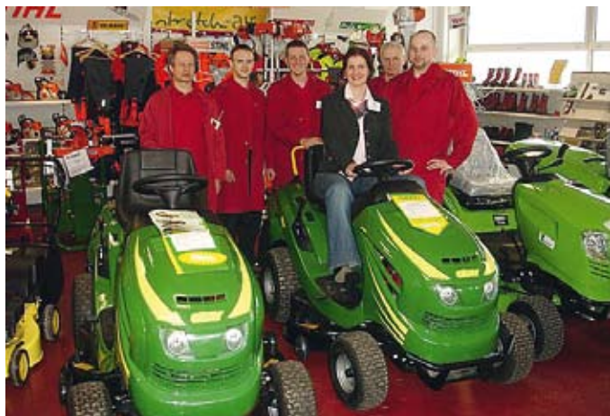
Das fachkundige Verkaufsteam im Technik Center Aigen/E.“

Der Wirtschaftspark Aigen lädt zur Messe, und alle kommen: Die bereits traditionelle Zentrumsmesse am 27. und 28. März 2009 mit ihren Bereichen Technik Center, Elektromann, Lagerhaus, Bau- und Gartenmarkt, Spar Supermarkt sowie Mode & Tracht war auch dieses Jahr wieder ein voller Erfolg.