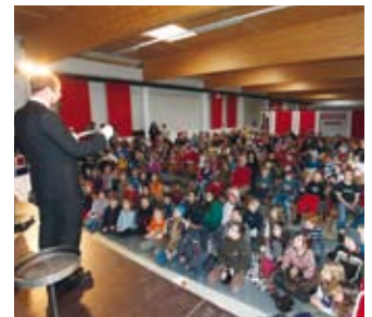
Die Zaubershow begeisterte die kleinen Zuschauer.