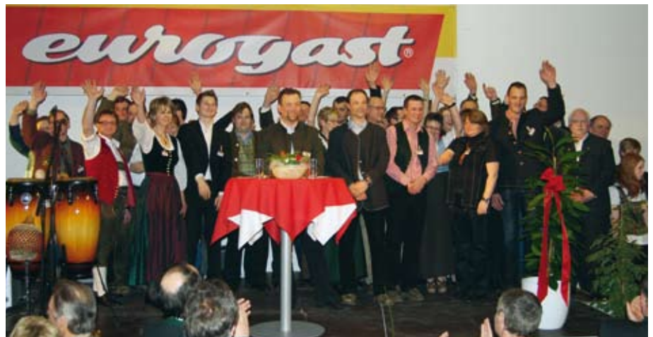
Das eurogast Mitarbeiterteam freut sich über den zukunftsweisenden Neubau und die gelungene Eröffnung.

eurogast Landmarkt lud ein, und an die 700 Gastronomen, Kunden und Lieferanten kamen zur Eröffnungsfeier und Einweihung des neuen eurogast C+C Marktes in Schladming am Dienstag, den 10. März 2009. Jeder einzelne der vielen Gäste war beeindruckt von den Ausmaßen unseres neuen Marktes, von seiner Dimension und großzügigen Auslegung. Viele sind sich sicher: „Dieser Markt ist für die Zukunft gebaut und wird die nächsten Jahrzehnte überdauern.“