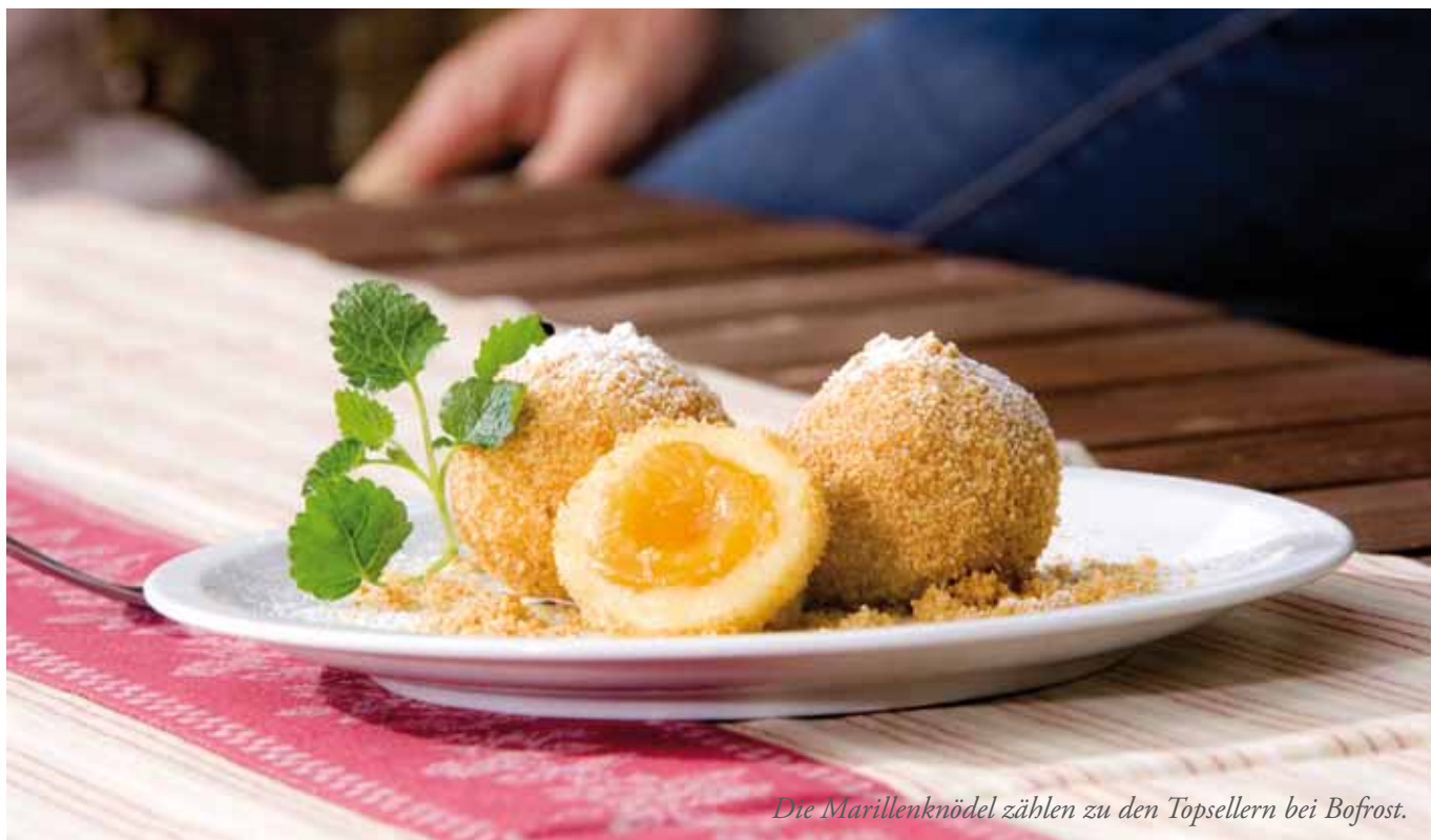
Die Marillenknödel zählen zu den Topsellern bei Bofrost.

wendeten Zutaten gestellt. Die Philosophie, tiefgekühlte Lebensmittel direkt in die Haushalte zu liefern, hat Maßstäbe gesetzt und so ist bofrost zu einer