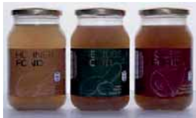
Die neuen Fonds für Suppen und Soßen

Nicht nur auf Tradition, sondern auch auf Innovation wird in der Landena KG viel Wert gelegt. Inspiriert von den unzähligen Kochsendungen, welche