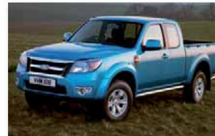
Der neue Ford Ranger soll den Erfolgs im Autohaus weiter unterstützen und ist auf dem besten Weg, ein Verkaufsschlager im robusten Einsatzbereich zu werden