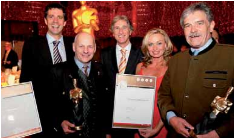
Der Gewinn von zwei „Käsekaisern“ ist Beweis für ein hohes Qualitätsniveau in der Ennstal Milch und stimmt zuversichtlich für die Zukunft.

Mit diesen Vorzeichen gehen wir auch optimistisch