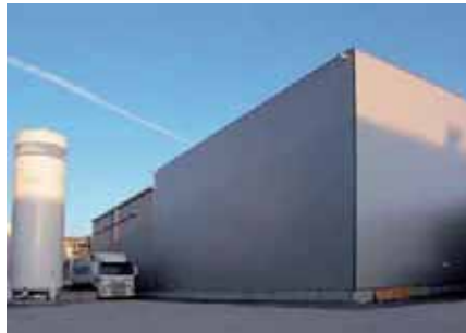
Mit dem neuen Zubau wird die Warenannahme sowie die Lagerung der Roh- und Fertigware ausgebaut.

Nicht nur die Warenannahme, sondern auch die Lagerung der tiefgekühlten Roh- und Fertigware wird ausgebaut. Zwei neue Tiefkühlkammer entstehen am Ost- und Westende der Landena KG.