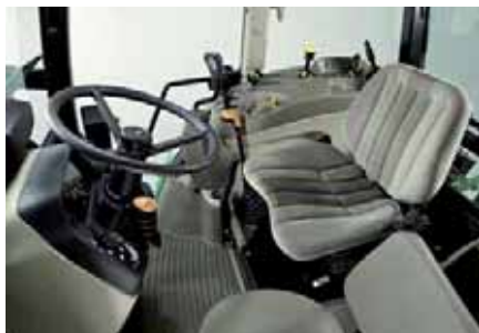
Die Innenausstattung des 5M spielt alle Stücke

Das offene Hydrauliksystem der 5M-Traktoren arbeitet mit einer leistungsstarken Tandempumpe mit