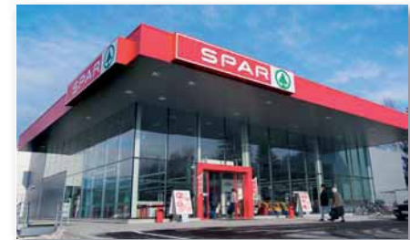
Zuwächse über dem Branchenschnitt auch im Supermarkt

gute mengen- und kostenmäßige Verbesserung in der Camembertkäserei in Stainach beigetragen. Für das Jahr 2010 gehen wir von einer weiteren Steigerung der Auslastung vor allem in unseren neuen Produktionsstätten aus, auch wenn die Wettbewerbssituation im In- und Ausland immer